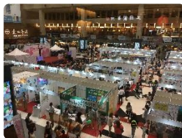
日本観光物産博覧会

過去最大数の来場者(約125,000名)のうち約8割が訪日経験があることから、より詳細な旅行地情報を求める場面も多く見られました。